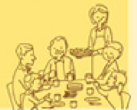
監修：がん研究振興財団