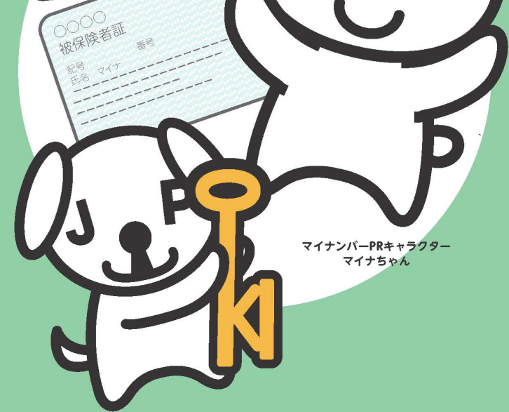
マイナンバー-PRキャラクター マイナちゃん